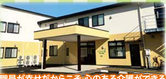
職員が幸せだからこそ心のある介護ができる