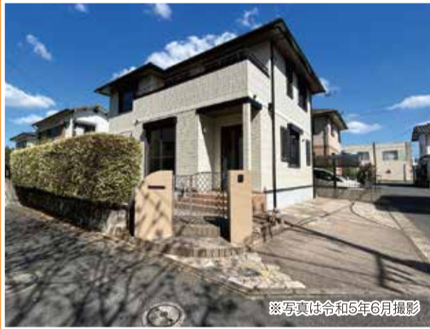
※写真は令和5年6月撮影