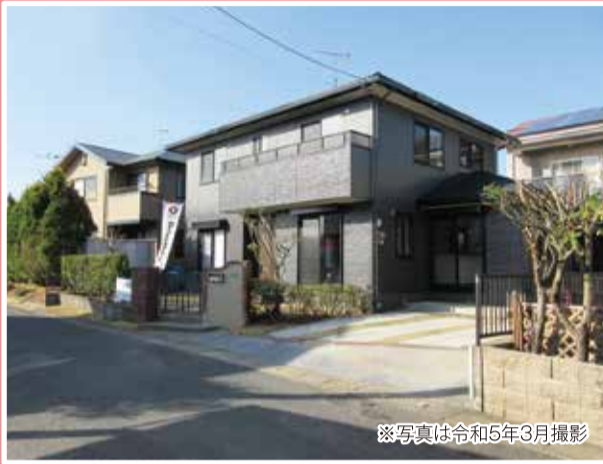
※写真は令和5年3月撮影