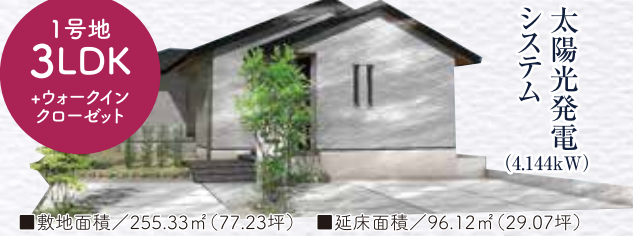
1号地 3LDK +ウォークインクローゼット

11月26日(土)・27日(日) 10:00 左記以外の日付でも承りますので、17:00 下記の電話番号までご連絡ください。 先着順申込受付中