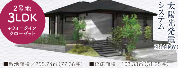
2号地 3LDK +ウォークインクローゼット