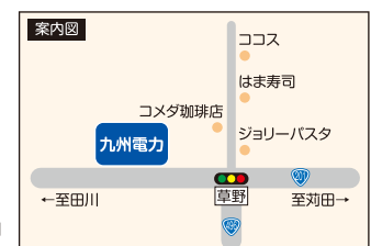
※写真・イラストはすべてイメージです。

【感染症対策のため、以下のとおりご理解とご協力をお願いいたします】 来所時に手の消毒、検温、過去2週間の体調チェック等をさせていただきます。また、体調チェック次第でご参加をお断りさせていただく場合がございます。(お子様も同様) 会場内ではマスクの着用をお願いいたします。